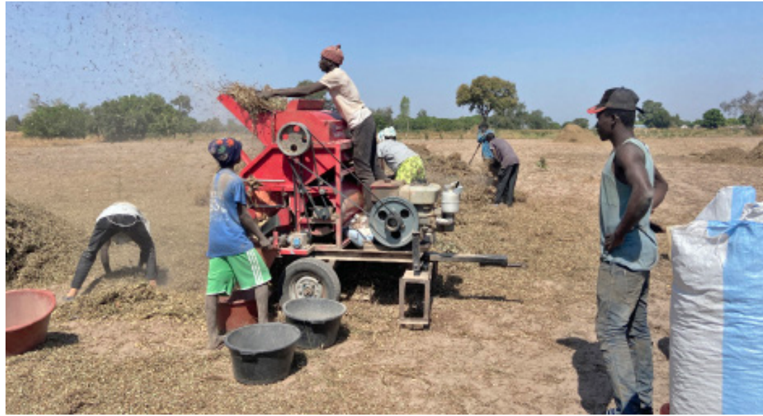
📍 Pindaooogst in Senegal. Met een machine scheiden de boeren de pinda's van de rest van de plant.